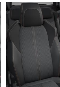
Tapicerka półskórzana Belomka Mistral