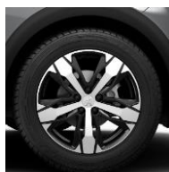
18" 'Los Angeles'