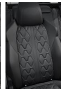
Tapicerka skórzana Nappa Mistral