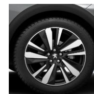
19" 'San Francisco'