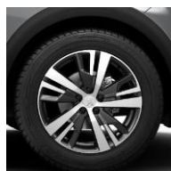
18" 'Detroit' Onyx Black