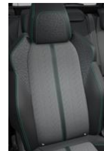
Tapicerka półskórzana Colyn Mistral