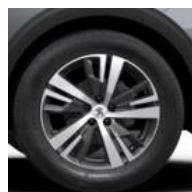
18" 'Detroit' Storm Grey